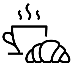
Bogate regionalne śniadania 07:00 - 10:00